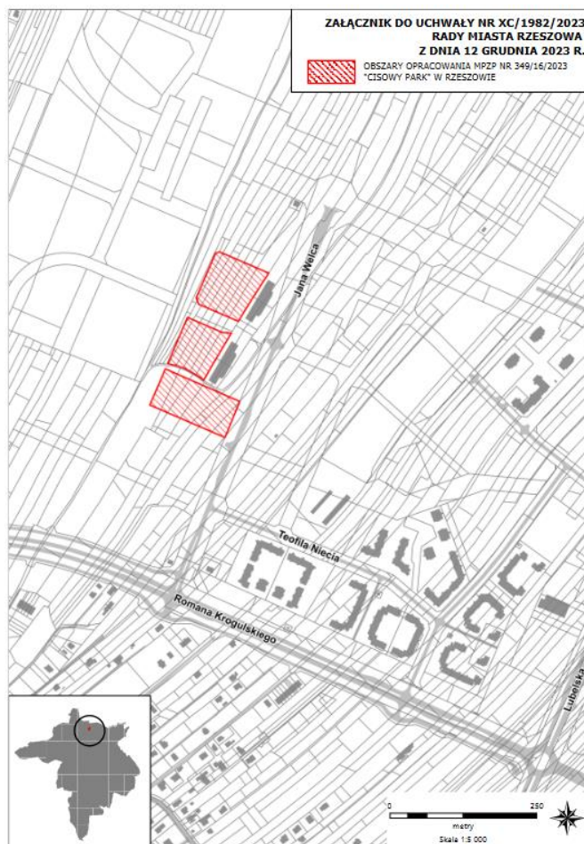
Rys. Orientacyjna granica terenu objętego mpzp nr 349/16/2023 „Cisowy Park” w Rzeszowie

Opracowaniem ekofizjograficznym objęto teren położony na osiedlu Staromieście, w rejonie ul. Welca.