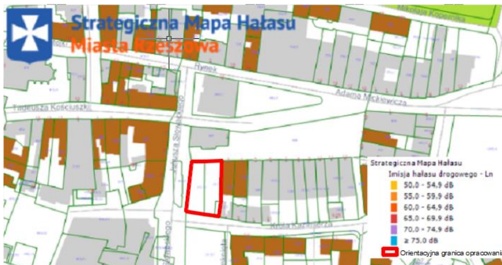
Strategiczna mapa hałasu drogowego Ln z nałożoną granicą terenu objętego mpzp