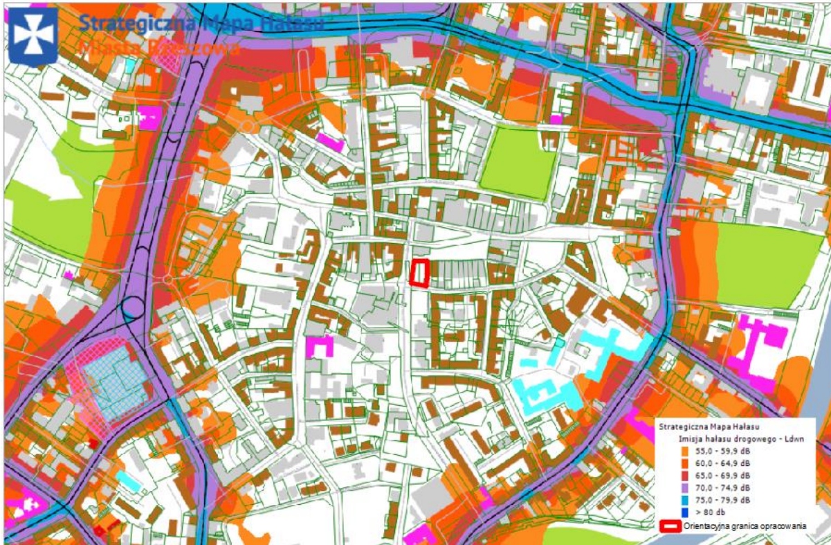
Strategiczna mapa hałasu drogowego Ldwn dla Śródmieścia wraz z granicą terenu objętego opracowaniem

Opracowana Strategiczna mapa hałasu dla miasta Rzeszowa w 2022 r., nie wykazała wartości hałasu w tym obszarze miasta.