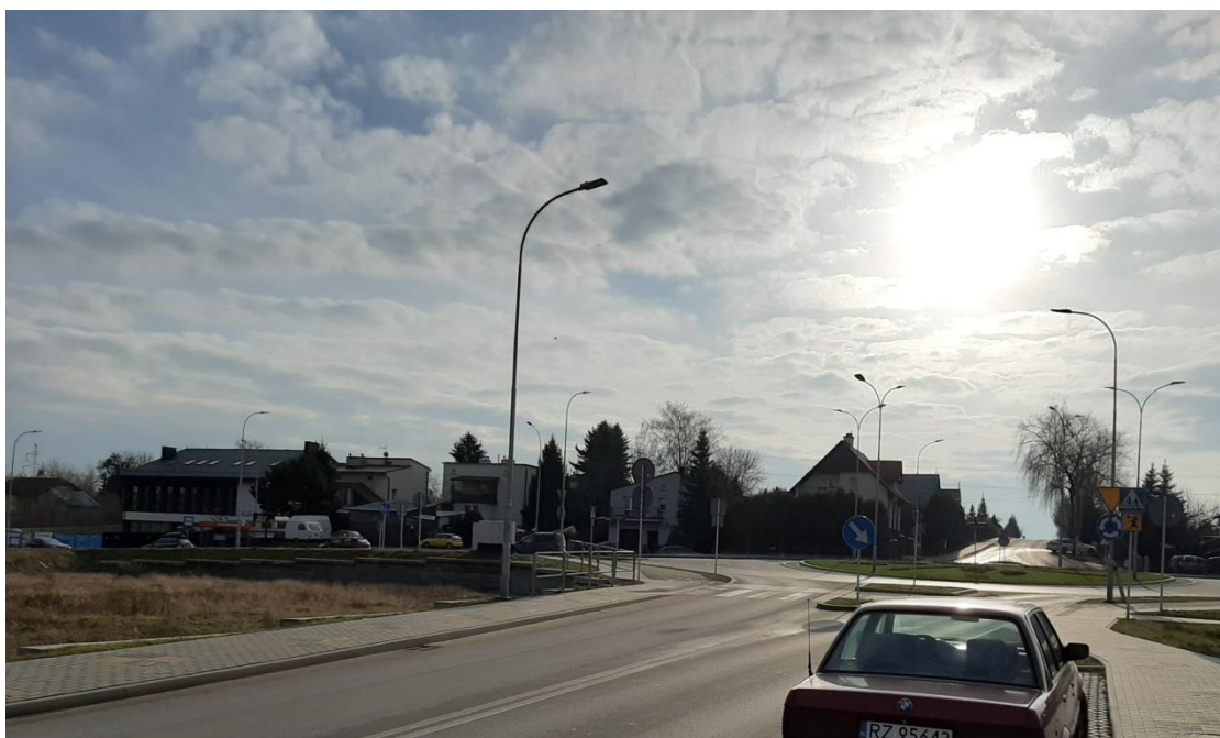
Południowa część terenu objętego projektem

Obszar osiedla, w granicach którego zlokalizowany jest teren opracowania, był niegdyś terenem upraw rolnych. Aktualnie jest to teren osiedla mieszkaniowego (os. Franciszka Kotuli). Jest to teren zurbanizowany i zagospodarowany. Dawne tereny rolne są stopniowo zabudowane obiektami mieszkalnymi, usługowymi, którym towarzyszą tereny zieleni urządzonej. Analizowany teren lokalizowany jest w bezpośrednim sąsiedztwie skrzyżowania ul. Błogosławionej Karoliny, będącej główną ulicą osiedla oraz ul. Strzyżowskiej.