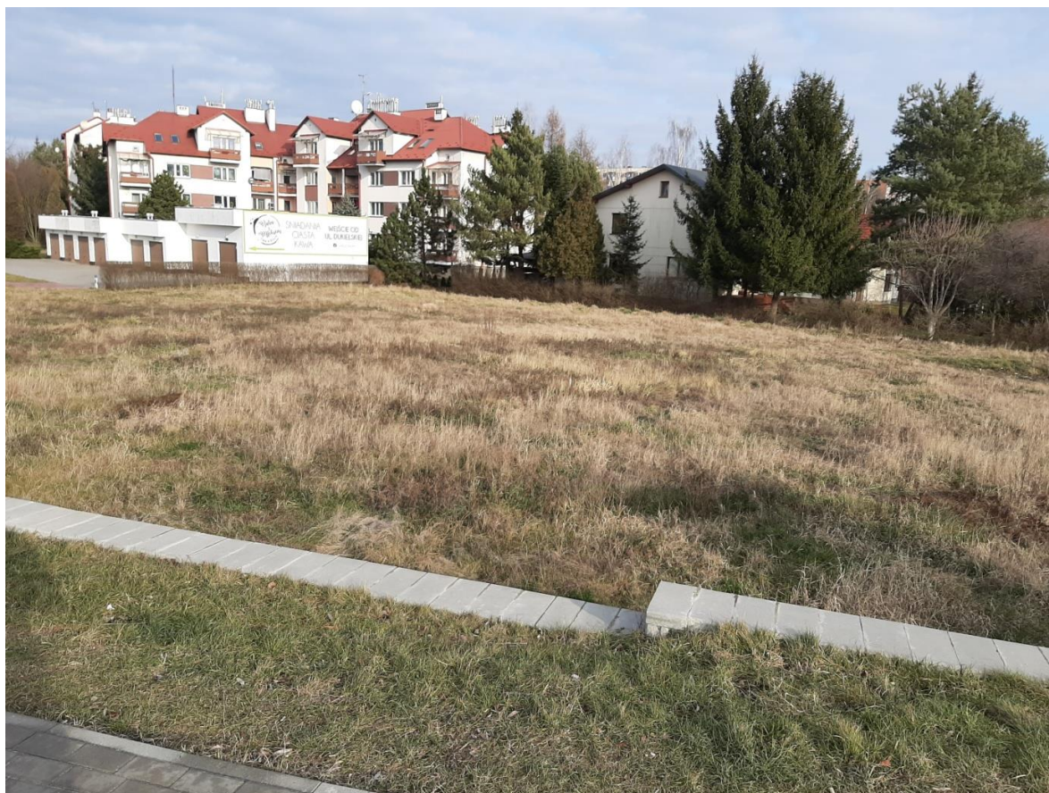
Teren objęty projektem planu