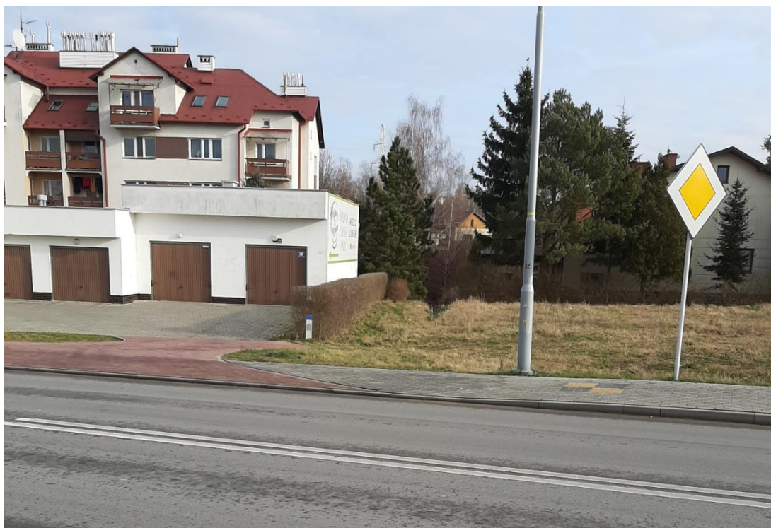
Północna część terenu opracowania projektu planu